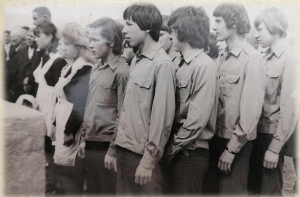
Митинг, посвящённый 35-летию со Дня Победы, 9 мая 1980 года